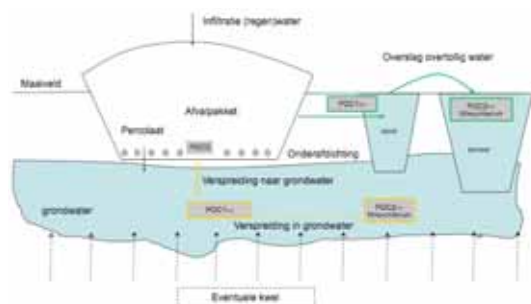
FIGUUR 1: CONCEPTUEEL MODEL STORTPLAATS. DE GELE LIJN GELDT VOOR EEN SCENARIO WAARBIJ ALLEEN INFILTRATIE NAAR GRONDWATER PLAATSVINDT. DE GROENE PIJL GELDT TEvens VOOR SITUATIES WAARBIJ VANWEGE KWEL AFSPOELING NAAR NABIJGELEGEN OPPERVLAKTEWATER PLAATSVINDT.

De milieucriteria die op het POC2 voor grondwater gelden zijn het Maximaal Toelaatbaar Risico voor ecologie ( MTR_{eco} ) voor zware metalen (bijvoorbeeld cadmium en lood) en macroparameters (zoals sulfaat, ammonium etc.). Voor organische microverontreinigingen zoals Polycyclische Aromatische Koolwaterstoffen (PAK's) en vluchtige koolwaterstoffen is gekozen voor het Verwaarloosbaar risico (VR). Tevens is rekening gehouden met de drinkwaternorm. De strengste van hetzij het MTR_{eco} voor metalen/VR voor organische microverontreinigingen of de drinkwaternorm is als uiteindelijk milieucriterium gekozen (zie ook kader).